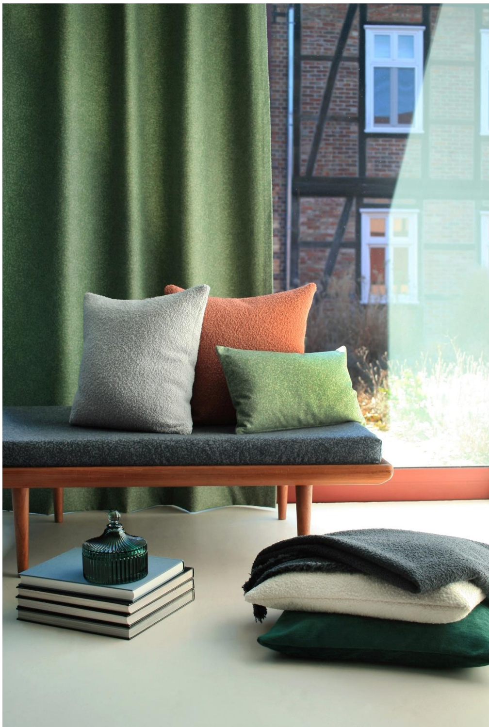
Rune (Tenda, Tessuto da rivestimento), Charlie (Cuscini, Plaid), Palermo (Cuscini)