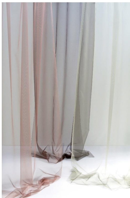
gauche: Marlene CS, droite: Alva FR

Les fleurs délicates de la clématite trouvent leur correspondance textile dans la transparence délicatement colorée d' Alva FR et dans les lignes courbes filigranes de Marlene CS , subtilement complétées par Chelsea qui scintille comme des gouttes de rosée. La douceur moelleuse de la mousse sert de modèle naturel à des surfaces captivantes au toucher laineux. Elle est incarnée par des tissus doux sous la main comme le bouclé de laine Charlie ou le motif organique de Rune , qui s'adressent autant aux yeux qu'aux bouts des doigts. La bruyère aux racines profondes s'inscrit dans le paysage sans pour autant s'imposer. Tout comme les basiques naturels Jonte , Jona et Scarlet , qui soulignent par leur toile légère et leur satin élégant la riche diversité du lin.