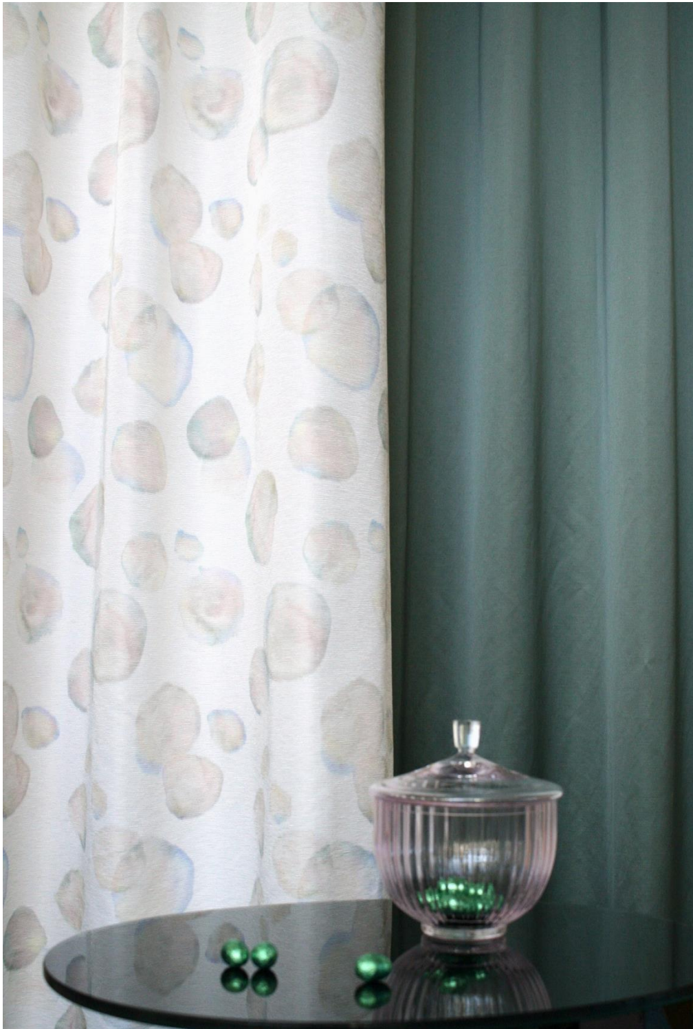
gauche: Chelsea, droite: Scarlet