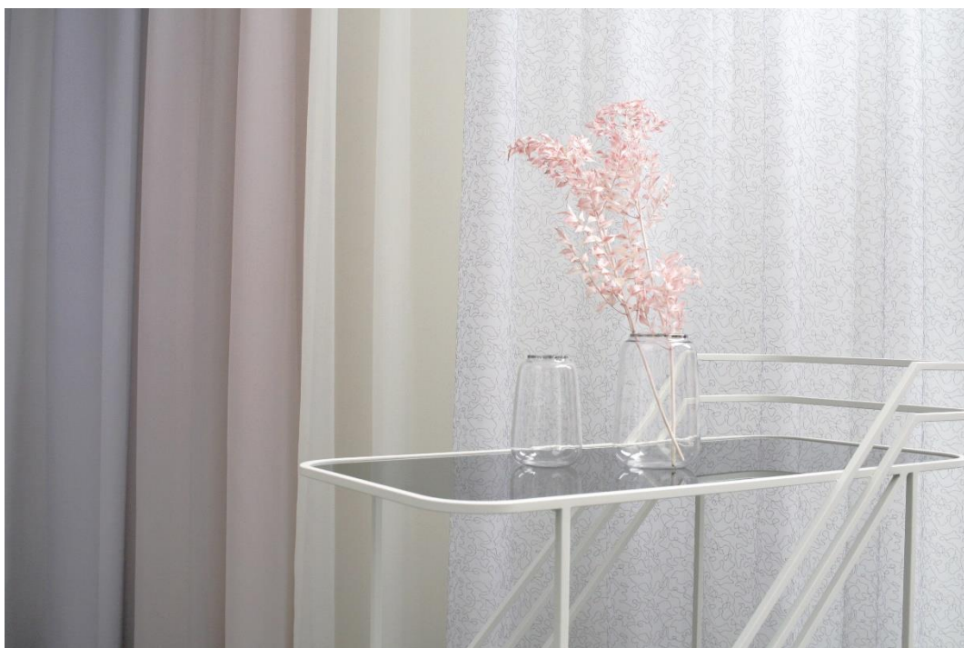
gauche: Marla CS, droite: Marlene CS

Une collection de tissus qui s'adresse à tous nos sens est constituée de divers composants en parfaite harmonie – comme un parfum qui n'éclot pleinement que dans la synergie de ses notes de tête, de cœur et de fond. Une image qui nous a guidés lors du développement de la collection nya nordiska 2021. Ces associations nous emmènent dans la nature nordique pure, qui offre tout ce qui constitue cette synergie fascinante. L'inspiration pour notre note de tête textile vient des fleurs délicates de la clématite, pour la note de cœur, dominée par le toucher, c'est la douceur d'un tapis de mousse, quant à la note de fond qui relie le tout, elle s'inspire de la bruyère. Le résultat est une composition textile équilibrée faite de familier et de nouveauté, de visuel et de toucher, de naturel et d'exclusivité. Inspirée par le parfum du Nord.